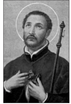
St. Franciskus Xaverius (1506-1552) virket som misjonær og er vernehelgen for arbeidet for utbredelse av troen

Det er et kirkebygg til å hvile ut i, kanskje til å gjenvinne noe av den ro og religiøse dybde som så ofte går tapt i dagens travle dagligliv.