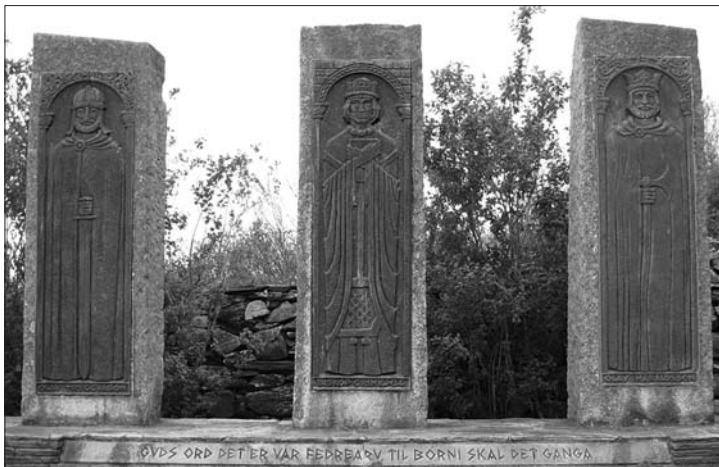
Et minnesmerke er reist utenfor Moster gamle kirke over kristenkongene Olav Tryggvason (t.v) og Olav Haraldsson (Hellig-Olav). I midten biskop Grimkell.