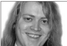
Deres ANDRÉ kantor

Hvis dere, som jeg, også ønsker dette, er akkurat nå den aller beste tiden for å gjøre noe med det. Meld dere inn i kirkekor! Til egen og andres glede!