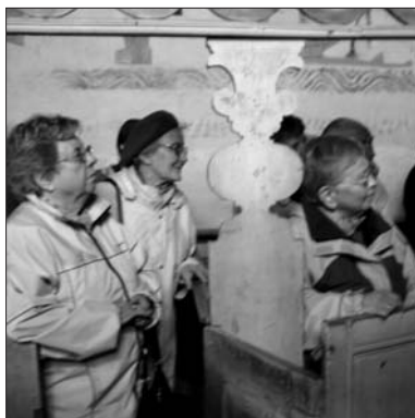
Andektige tilhørere lytter til sogneprestens preken under messen for St. Paul menighet i Moster gamle kirke.