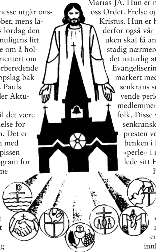
Nattlig sakramentstilbedelse står på programmet i Evangeliseringsuken.

Fader vår. Resten av menigheten i benkene svarer. I kirken vil lysene være slukket og ved mysteriene lyserøde lamper. Dette er en vanlig måte å innlede en Grand Mission på, for eksempel i Sri Lanka.