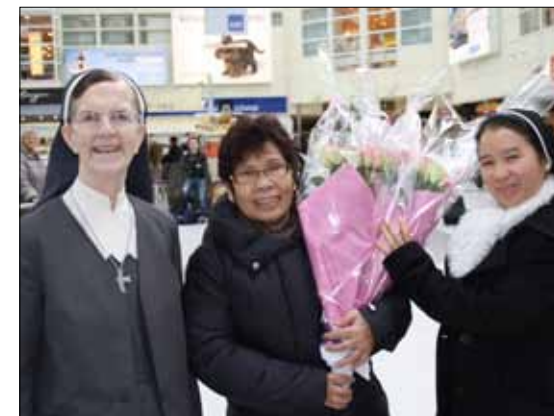
M. Mary (t.v.) fra Marias Minde var også på plass på Flesland for å ønske velkommen. Alle de nye søstrene fikk overrakt hver sin blomsterbukett.

Vi ønsker de nye søstrene hjertelig velkommen til Bergen og St. Paul menighet og håper de vil trives hos oss.