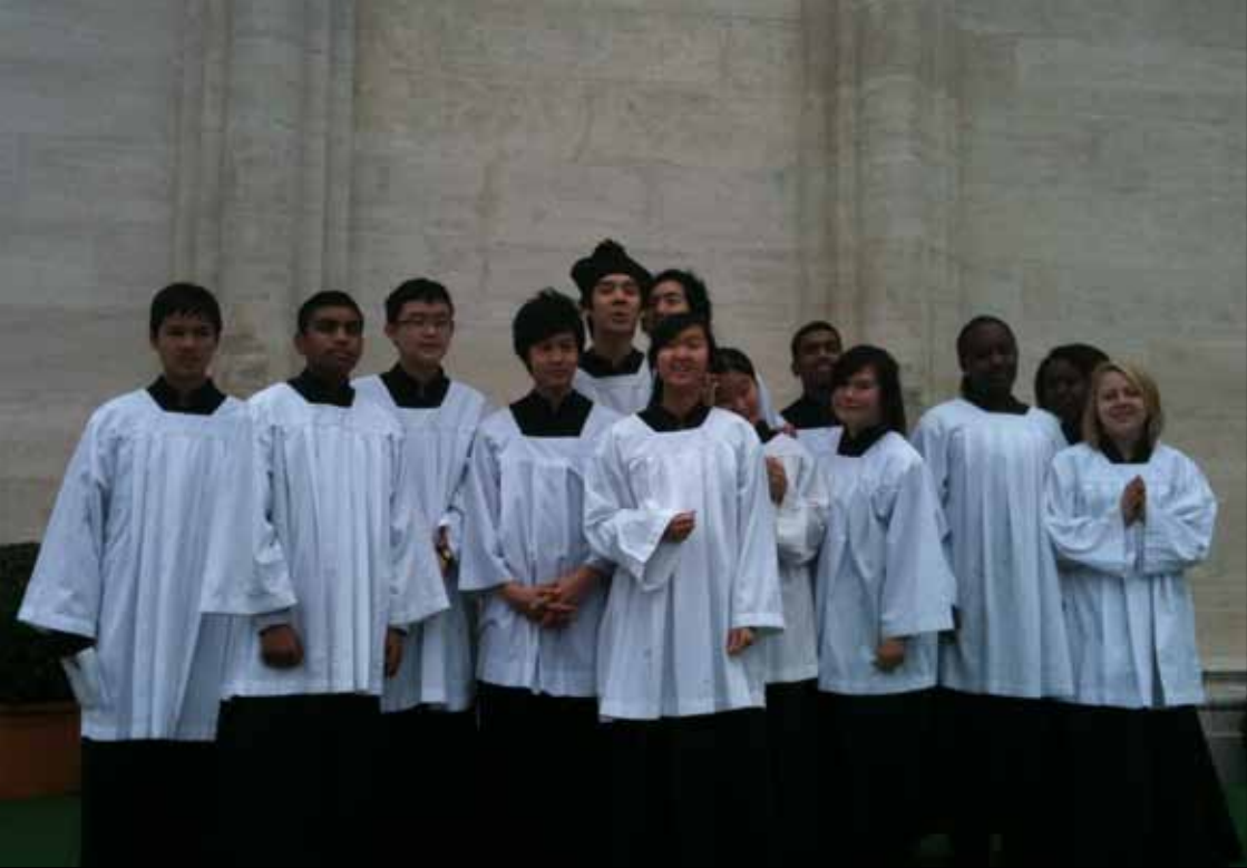
I november dro 15 ministranter fra St. Stefanus ministrantlag sammen med Dom Lukas på pilegrimsferd til Kloster Neuburg.