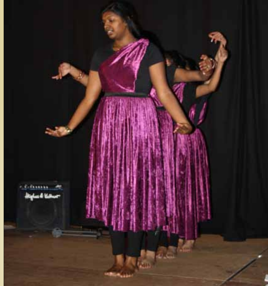
Tamilske unge danser på menighetsfesten i St Paul skoles gymnastikksal etter høymessen 30. januar