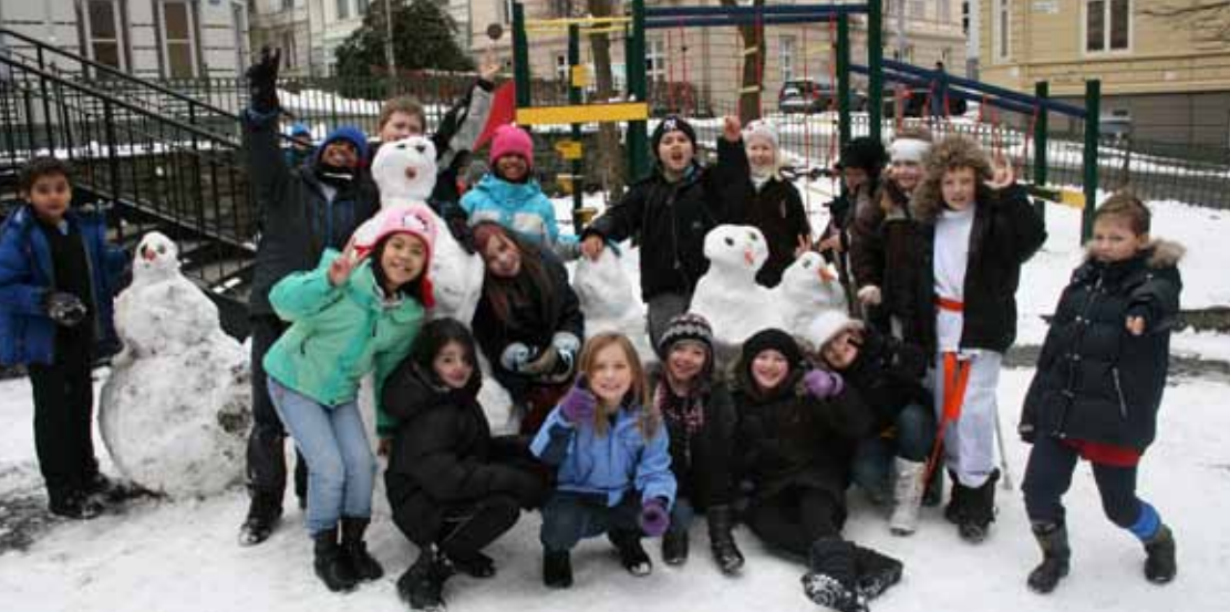
Elever fra St Paul skole koser seg med vinteraktiviteter

”Vi møter Gud som den ytterste DU”, en dannelsesprosess der det er utrolig viktig med variasjon, kontinuitet, forutsigbarhet og trygghet. Jesu inspirasjon må bli oversatt fra det ideelle til det realistiske.