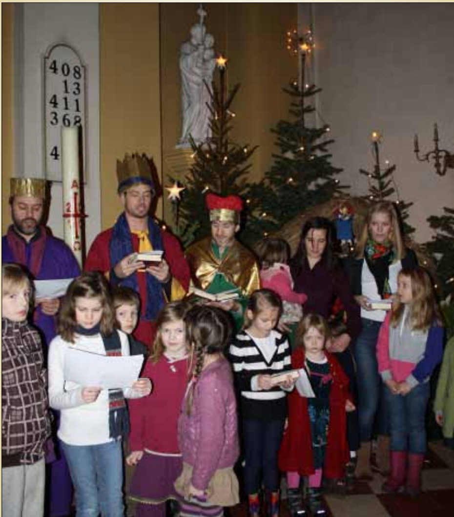
I høymessen Hellig Tre Kongers Fest 9. januar deltok både store og små med korsang.

Ved flytting, husk å melde adresseforandring! Ettersendes ikke ved varig adresseforandring, men returneres til avsender med opplysning om den nye adressen.