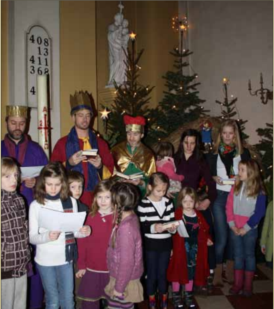
I høymessen Hellig Tre Kongers Fest 9. januar deltok både store og små med korsang.

Ved flytting, husk å melde adresseforandring! Ettersendes ikke ved varig adresseforandring, men returneres til avsender med opplysning om den nye adressen.