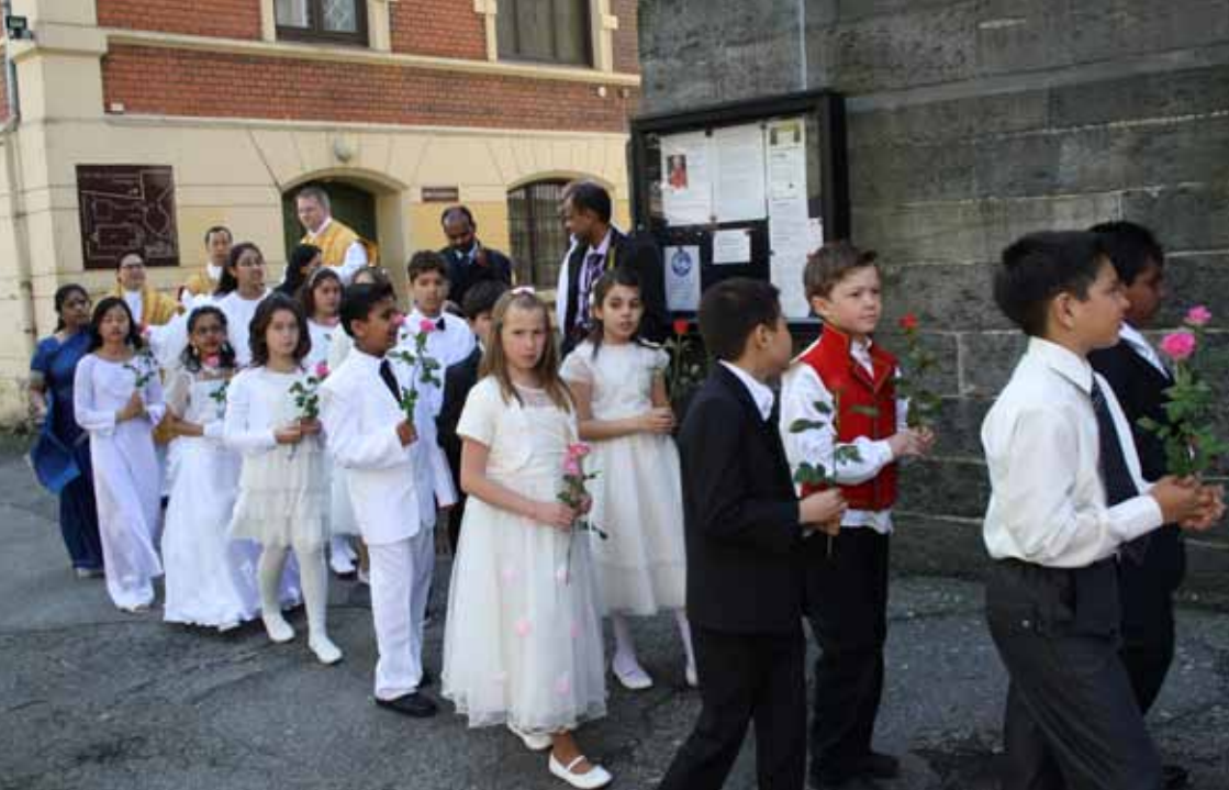
Førstekommunionbarn på vei inn i kirken 7. mai (over) og i skoletrappen etter messen 8. mai (under).