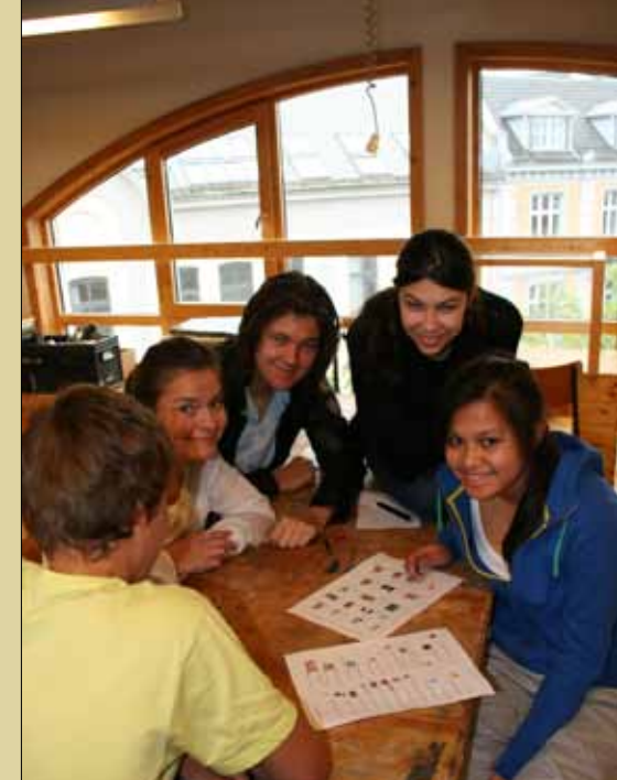
Kul retrett på St. Paul skole.

Kirken har i over 2000 år tatt vare på en tradisjon som bygger på Kristi eksempel