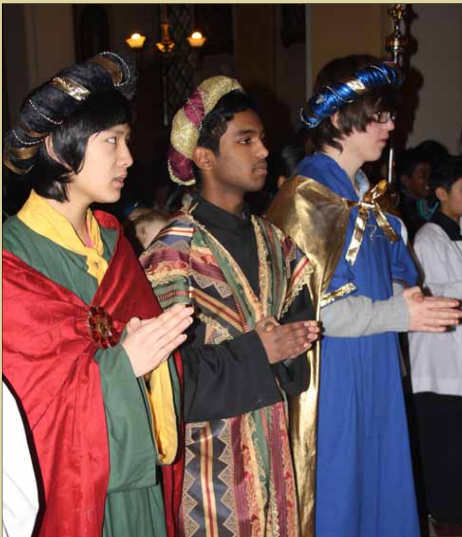
De hellige tre konger var tilstede på Epifani-messen 8. januar

Ved flytting, husk å melde adresseforandring! Ettersendes ikke ved varig adresseforandring, men returneres til avsender med opplysning om den nye adressen.